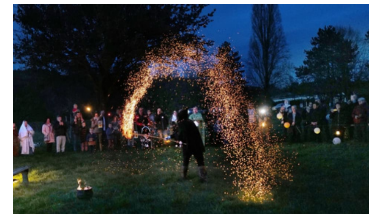
La compagnie Les Troubadours Débridés a enchanté le public à la nuit tombée avec son spectacle de feu magique.

Le marché de créateurs locaux, dont les artisans de l'association Cré'artis à Bourgueil, a également agrémenté la journée, qui a bénéficié d'une météo assez favorable, pour le plus grand plaisir des participants. En fin de journée, la compagnie Les Troubadours Débridés a enchanté petits et grands avec un spectacle équestre et de feu autour de l'étang de Continvoir, illuminé pour l'occasion.